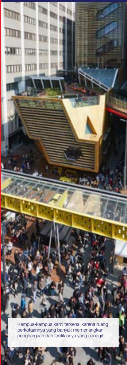
Kampus-kampus kami terkenal karena ruang perkotaannya yang banyak memenangkan penghargaan dan fasilitasnya yang canggih